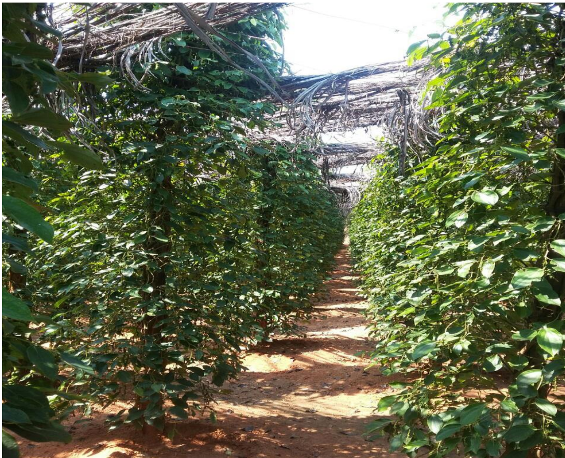
نمایی از یکی از عرصه‌های کشت فلفل گرمسیری